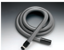
Saugschlauchverlängerung (Länge: 3 Meter)