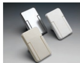
Saugdosen für den Wandeinbau (Farben: Reinweiß, Cremeweiß oder Chrom matt)