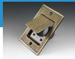
Saugdose für den Fußbodeneinbau (Farbe: Bronze)

Die VACUCLEAN-Saugdosen sind speziell entwickelt. Aus Metall bzw. Kunststoff gefertigt überzeugen sie durch ihre hohe Dichtigkeit und ihr optisch ansprechendes Design. Für den Einbau der Saugdosen wird kein spezielles Werkzeug benötigt.