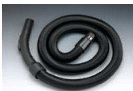
Stretchsaugschlauch (flexibel dehnbar von 2 Meter auf 6 Meter)