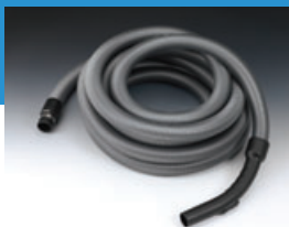
Saugschlauch (Länge: 8 Meter)

Der VACUCLEAN-Saugschlauch hat im Schlauchinneren eine nahezu glatte Oberfläche, die den Luftwiderstand verringert. Dies unterstützt die starke Saugleistung des Gerätes. Die Saugkraft kann am Handstück des Saugschlauches stufenlos reguliert werden.